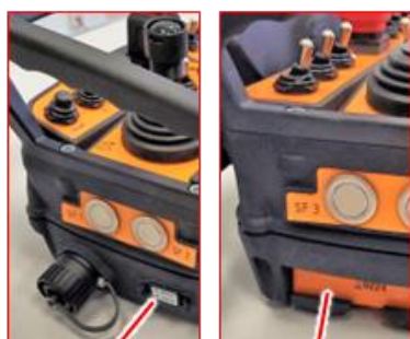
Gross Funk V21