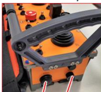
Gross Funk K2/K2+